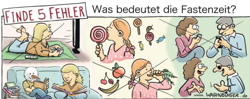
Schneemannkopf, Käfer, falsches Bild durchgestrichen, Augenklappe

auf Süßigkeiten. Aber der Sinn ist nicht, auf etwas zu verzichten, um zum Beispiel schlanker zu werden, sondern um sich auf das Leiden und Sterben Jesu vorzubereiten. Das steht nämlich am Ende der Fastenzeit, am Karfreitag. Deshalb heißt die Fastenzeit auch Passionszeit. Passion ist ein lateinisches Wort und heißt Leiden. Nicht wir selbst sollen leiden, sondern wir bereiten uns vor auf das Leiden Jesu. Indem wir zum Beispiel in der Bibel lesen, anderen Menschen helfen, den Geschwistern und Eltern zum Beispiel. Indem wir nicht so sehr an uns denken, sondern an andere, wie Jesus nicht an sich gedacht hat, sondern an uns.